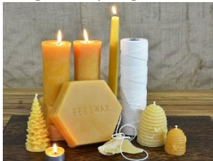
Picha 3: Mshumaa, nta, polen(kwenye glasii kushoto), asali na sega la nyuki

Sumu ya Nyuki (Bee venom): Hutumika katika tiba za asili, katika vipodozi (krimu za kuchochea upya wa ngozi, kupunguza uzee)