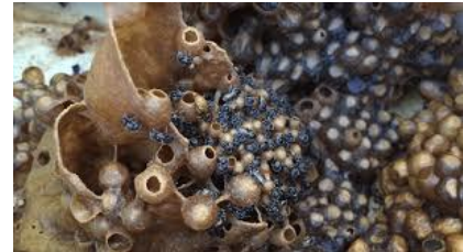
Picha 4: Kundi la nyuki wadogo