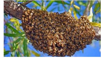
Picha 2: Kundi jipya limemzunguka na kumlinda malkia

Swarming ni njia ya kiasili ya nyuki kuzalisha makundi mapya. Mzinga ukijaa au malkia akizeeka, sehemu ya kundi huondoka na malkia ili kuanzisha mzinga mpya. Hii husaidia kulinda na kuendeleza kizazi cha nyuki.